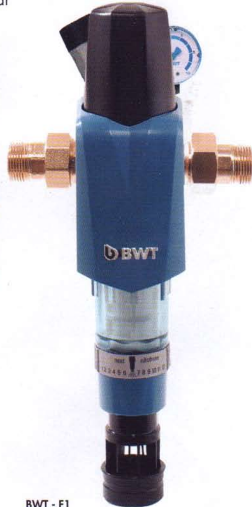
BWT - F1 Hauswasserstation

Die Serie F1 (Nenndruck PN 16, Betriebsdruck min./max. 2-16 bar (bei Rückspülung), Wasser-/Umgebungstemperatur max. 30/40° C) ist auch als komplette Hauswasserstation inklusive Druckminderer verfügbar. Die Filterserie zeichnet sich durch erstklassige Qualität und ein modernes Design aus – passend zum Weichwassergerät AQA perla und zur alternativen Wasseraufbereitungsanlage AQA total Energy von BWT.