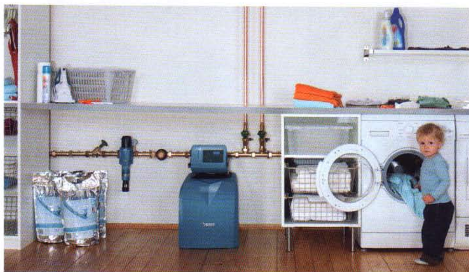
BWT - AQA smart: 1-Säulen-Weichwasseranlage findet durch seine kompakte Bauweise überall Platz.

AQA smart arbeitet mit dem bewährten AQA perla-Ventil - die perfekte, ökologisch wie ökonomisch optimierte 1-Säulen-Weichwasseranlage von BWT.