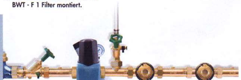
1- 2 - 3 - fertig