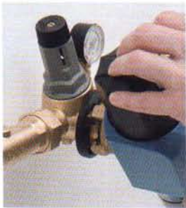
1. Filter aufstecken