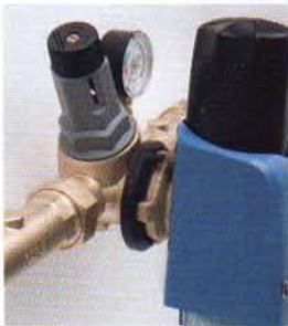
2. Filter drehen