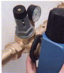
3. Filter sichern ... und schon ist das Meisterstück BWT - F 1 Filter montiert.